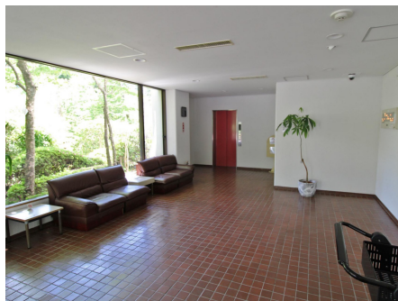
エントランスロビー