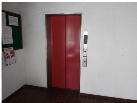
エレベーターあり