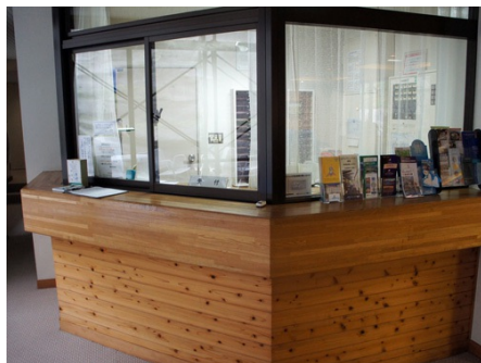
ウッド仕立てのフロント