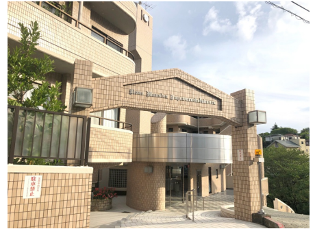
マンション入口(4階)