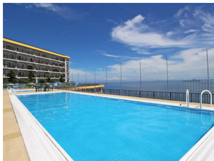
開放的な屋外プール