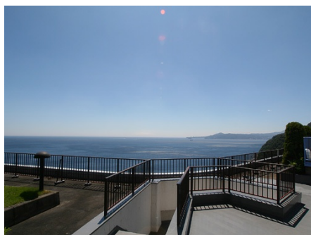
屋上庭園からの眺望