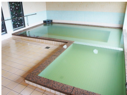
掛け流しの温泉大浴場