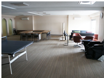
卓球台とマッサージ機がある娛樂室