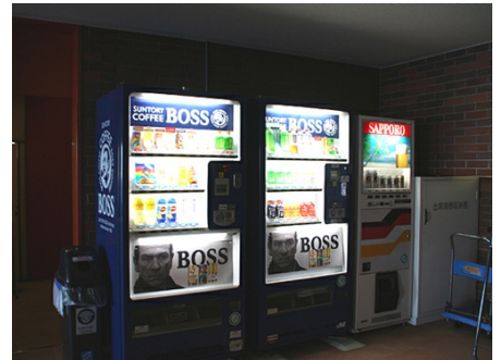
自販機コーナーもあります