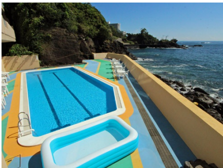
波打ち際のプール