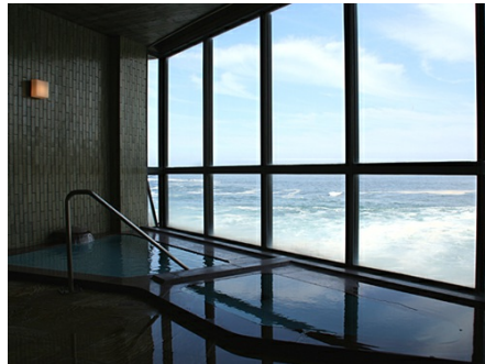
目の前は海の迫力の温泉大浴場