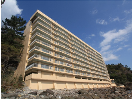
海岸沿いの熱海ターガスマンション