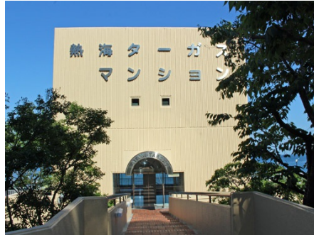
国道からのアプローチ