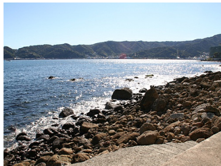
海岸にも出れます