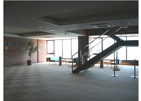
海を望む広いロビー