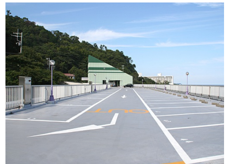
約60台止められる屋上駐車場