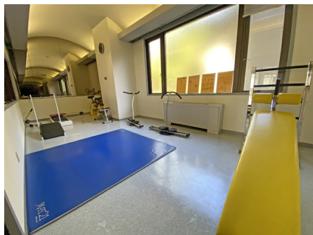
アスレチックルーム