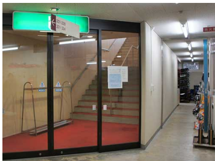
隣接したスキー場へのアプローチ