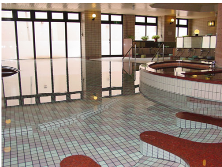
ジャグジー付き大浴場