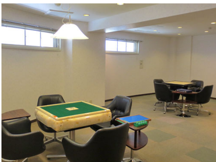
麻雀ルーム（全自動麻雀卓あり）