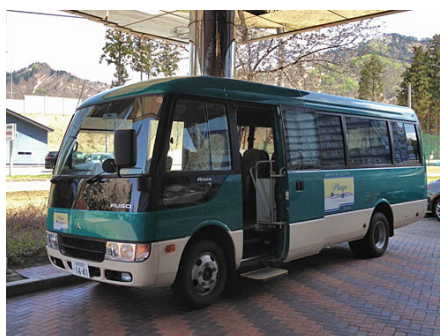
送迎シャトルバス