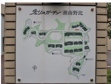
チュリスガーデン湘南野比