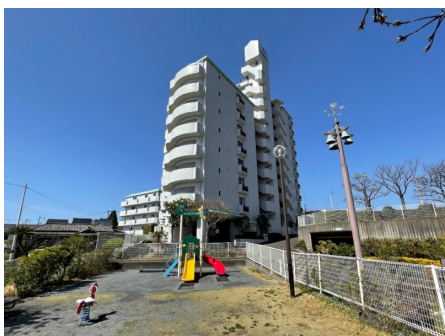
隣接する公園と外観