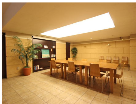
コミュニティスペース