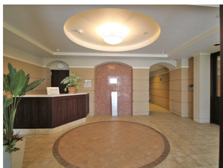
エントランス内部