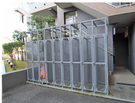
サーフボード置場