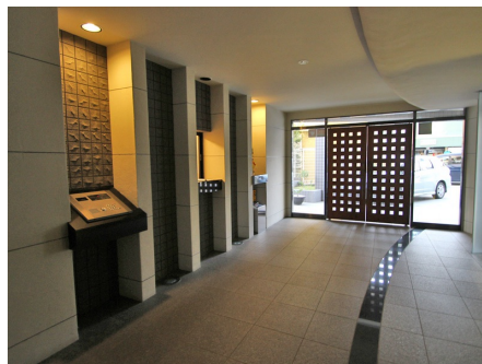
エントランス内部