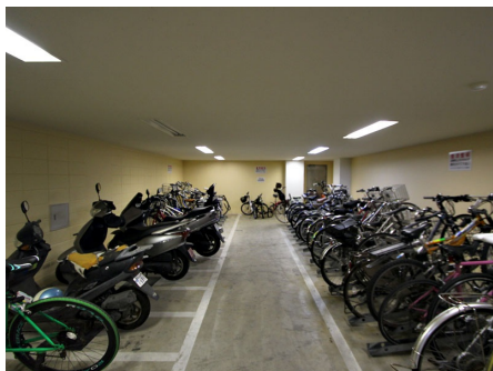
バイク置場・駐輪場