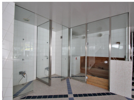
サウナ・シャワールーム