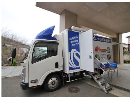
サービス付高齢者向け住宅とクリニックが併設