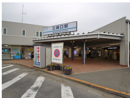
徒歩2分の京急三崎口駅