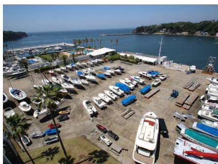
シーボニアマリーナ