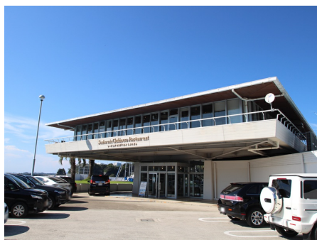
レストラン（マリーナ内）