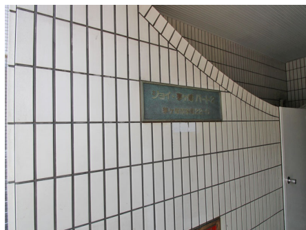
マンション入り口