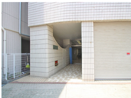
マンション入り口