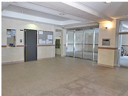
エントランス内部