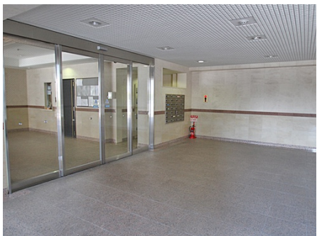
オートロックの自動ドア