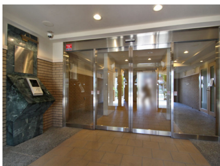
オートロック付き