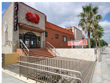
目の前のイルキャンティ・ビーチ