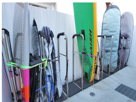
サーフボード置場