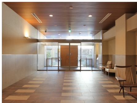
エントランス内部