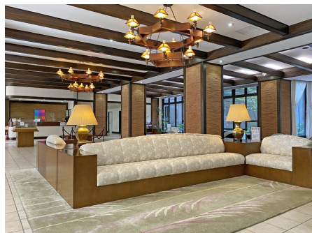
落ち着いたあるロビー