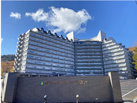
マウントマリーナ草津A棟 外観