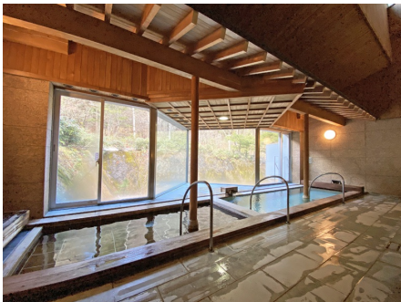
温泉大浴場はH18年に大改装済みです！