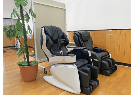
マッサージチェアでリラックス