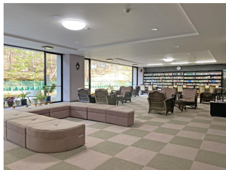
古書の貸し出しサービスも！