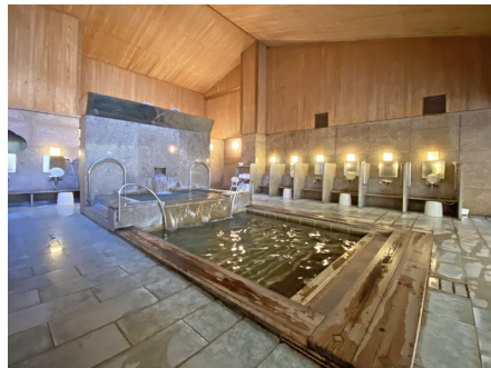
真湯のお風呂もあります