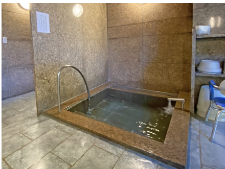
水風呂もあります