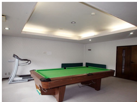
ビリヤードコーナー