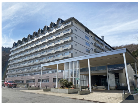
マウントマリーナ草津B棟 外観