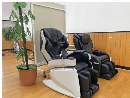
お風呂上がりにマッサージチェアで・・・