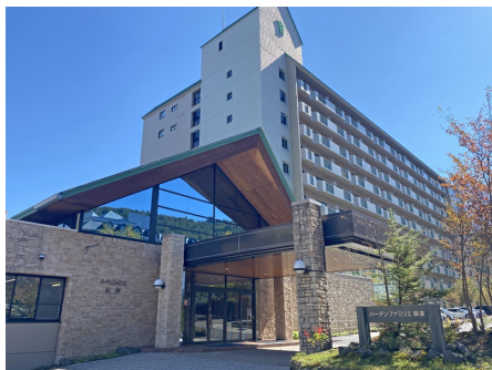
バーデンファミリエ草津 外観