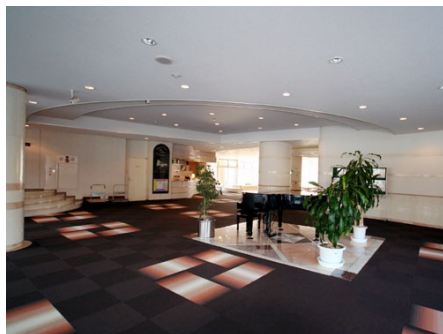
ロビーにはピアノもあります