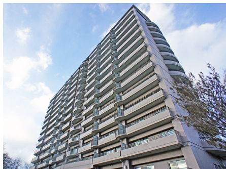
グランビュー北軽井沢外観