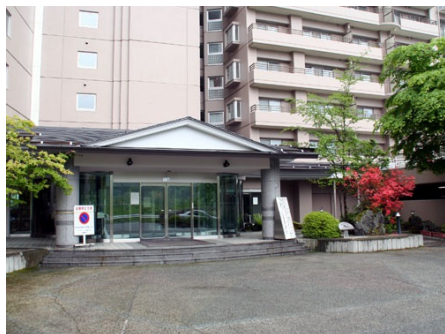
エントランス外観