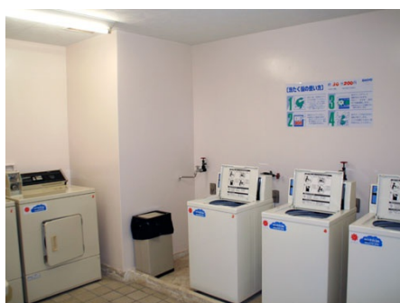
コインランドリー