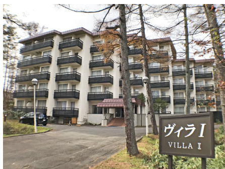
中沢ヴィレッジ・ヴィラI 外観