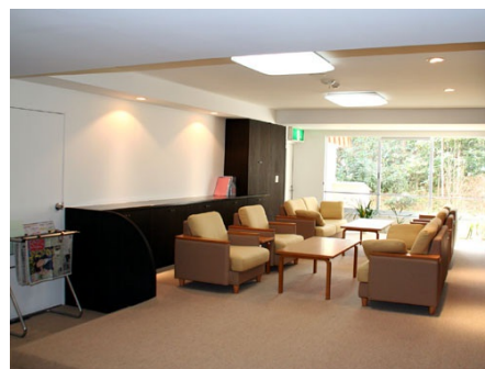
落ち着いたあるロビー