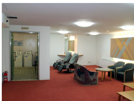
湯上がりは、大浴場横の休憩室で・・・