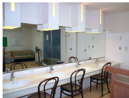
清潔感のある脱衣室