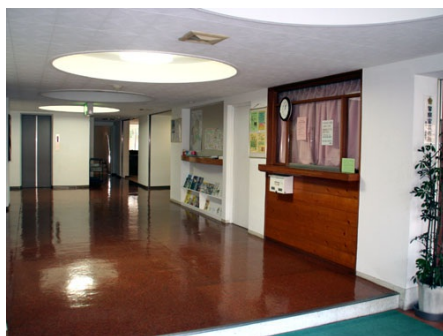
広々としたエントランス