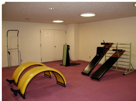
アスレチックルーム