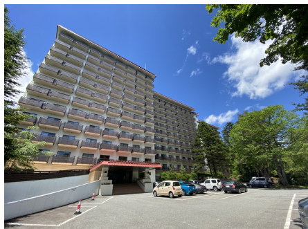
中沢ヴィレッジ・ヴィラV 外観