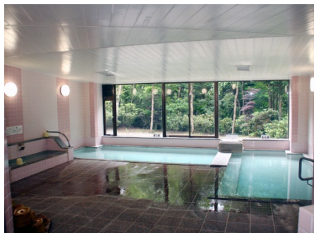
採光の取れた温泉大浴場