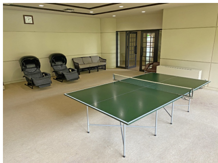
卓球台があります