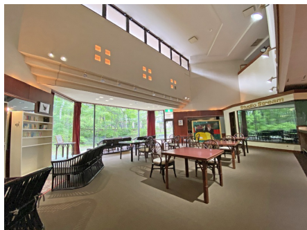
吹抜けで開放的なフリースペース