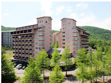
クアリゾート草津 外観