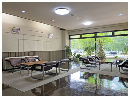
落ち着いた雰囲気のリビー