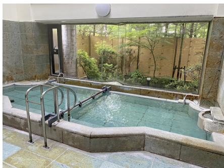
温泉大浴場はもちろん源泉かけ流し