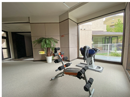
大浴場前の休憩コーナー