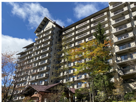
ソネット草津 外観