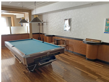
ビリヤード台があります