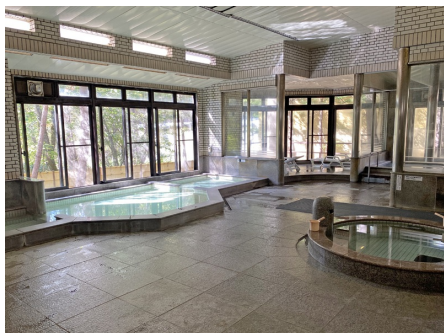
温泉大浴場（かけ流し）