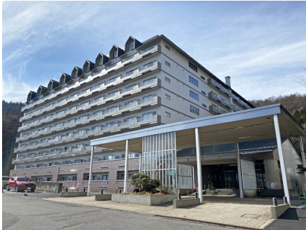
マウントマリーナ草津B棟 外観