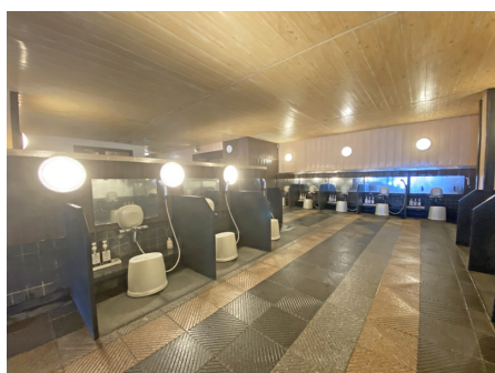
個別に仕切られた洗い場