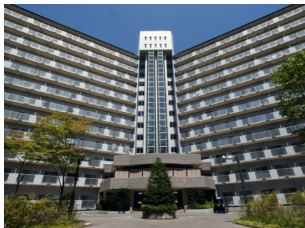
クルトーア草津 外観