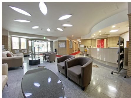
リゾート感あふれるロビー