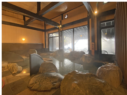
ビッグバスの温泉大浴場はかけ流し