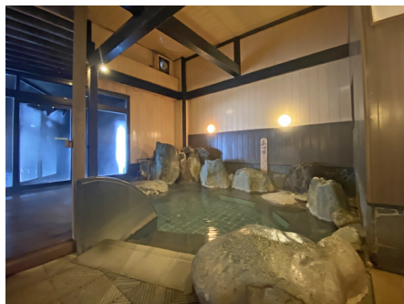
ぬる湯（40度）とあつ湯（42度）が楽しめます