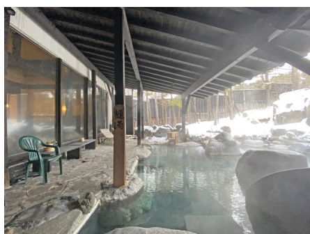
季節の移ろいを楽しめる露天風呂