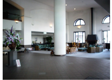
ゆったりとくつろげるロビー