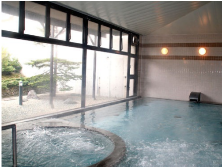
アゴラクラブ大浴場