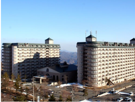
ハイクレスト草津アーバンリゾート 外観