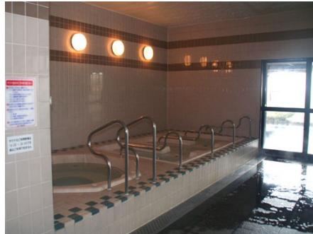
各種ジャグジー風呂