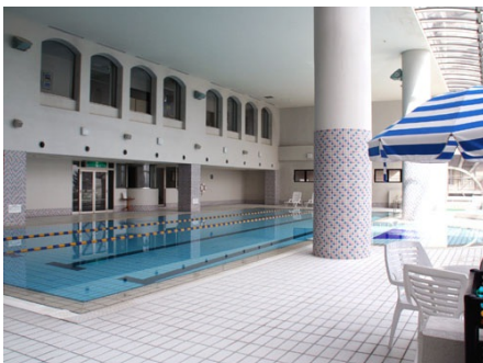
20mの屋内温水プール