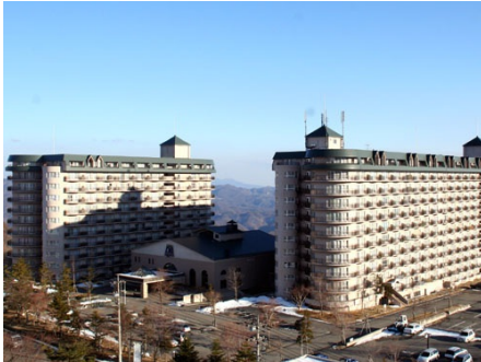
ハイクレスト草津アーバンリゾート 外観