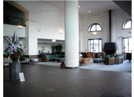
ゆったりとくつろげるロビー