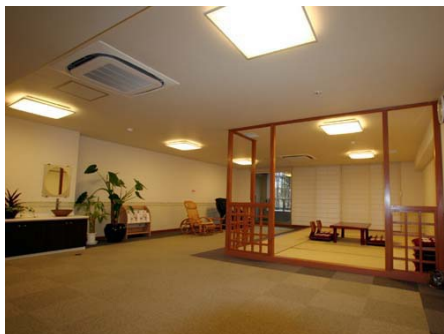
スパラウンジでちょっと休憩も