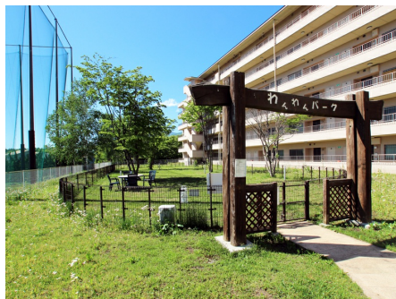
ドッグランでワンちゃんも遊べます