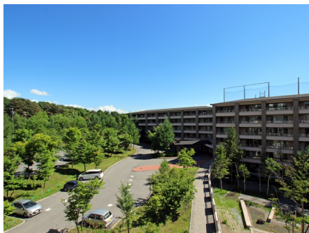
ヴァンデュール西軽井沢 外観