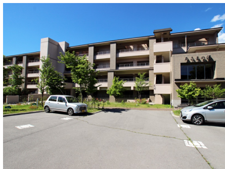
ヴァンデュール西軽井沢 外観