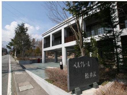
外観と接道の様子