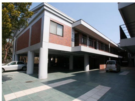
駐車場とマンション外観