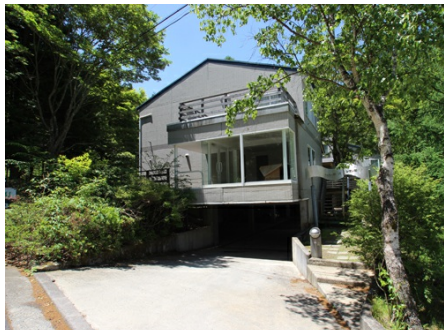
フォルム軽井沢レマン湖 外観