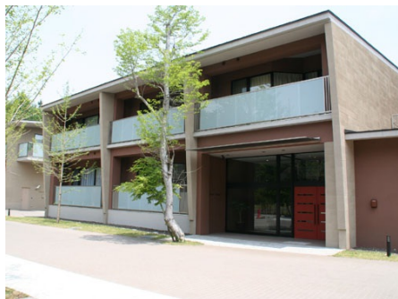
外観 エントランス