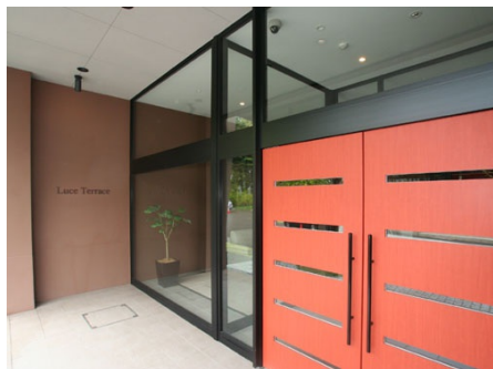
エントランス外観