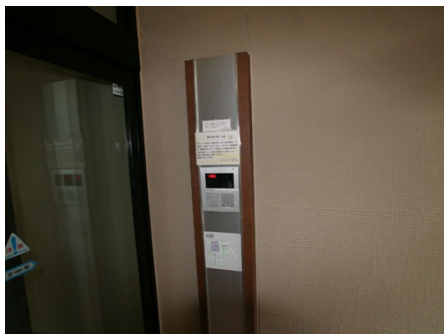
24時間オートロック