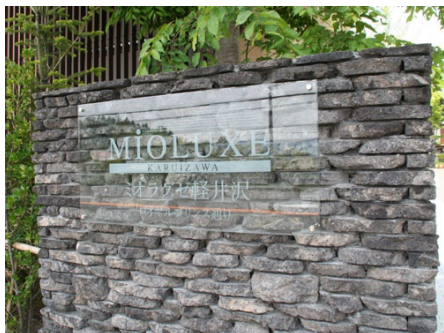
マンションエンブレム