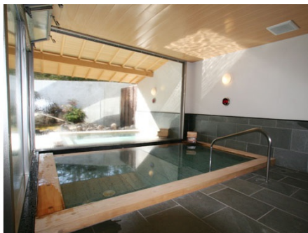
マンション内 大浴場