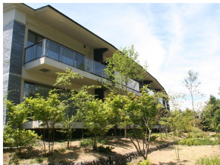
メビウスブレイン軽井沢 外観