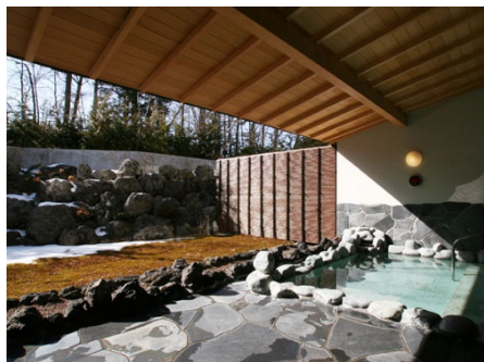
マンション内 露天風呂