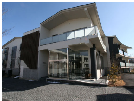
メビウスブレイン軽井沢 外観