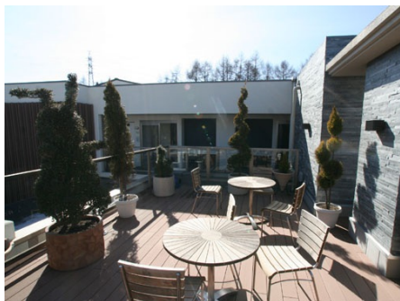
解放感溢れるビューラウンジ