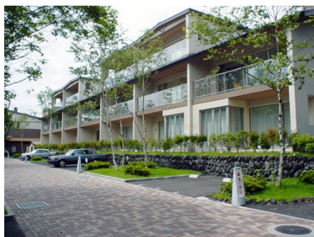
ベルジュール軽井沢 外観