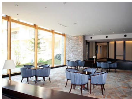
高級感のあるロビー