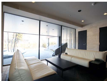
高級感のあるロビー