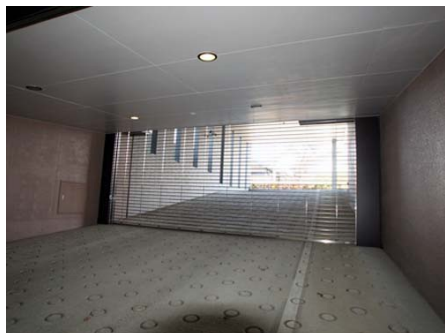
地下駐車場にはゲートがあります