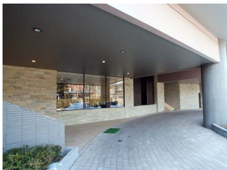
屋根付きのロータリー