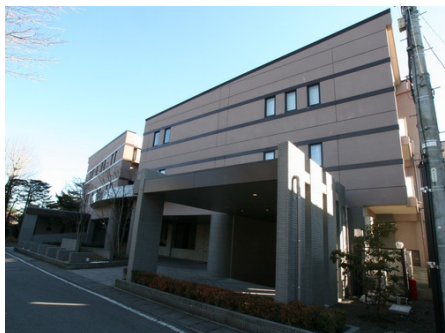
レーベンリゾシア 外観