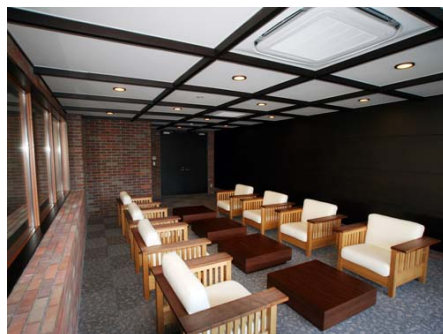
ゆっくりくつろげます