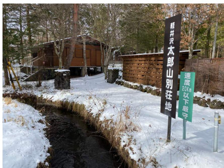
別荘地入口看板と千ヶ滝用水

中軽井沢と追分の中間地点に位置する太郎山別荘地。西武千ヶ滝別荘地西区の南西に位置します。区画数は少なく山の斜面を利用した落ち着いた雰囲気のある別荘地です。