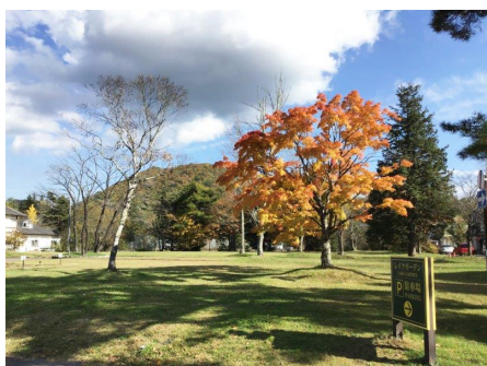
管理事務所前の景観