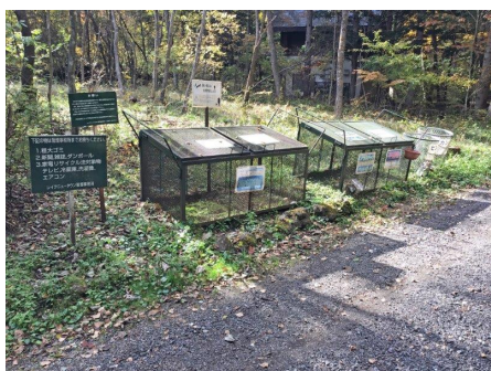
ゴミ捨て場（各所にあり）