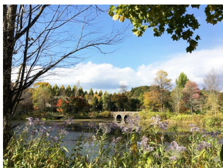
別荘地内レマン湖