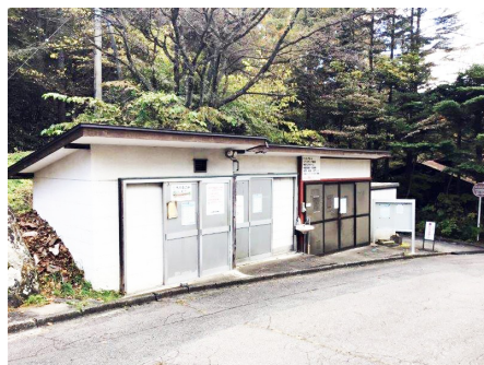
管理事務所前にあるゴミステーション