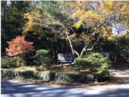
三笠パーク入り口

離山の北側に位置する旧軽井沢エリアの管理別荘地。傾斜の区画が多いですが、その分眺望の取れる区画もあり、眺望重視の方にオススメです。管理体制も良好な別荘地です。