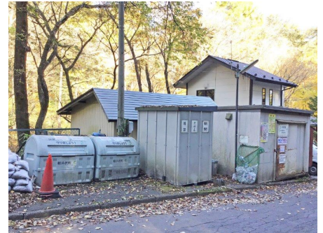
ゴミ置き場（管理事務所横）