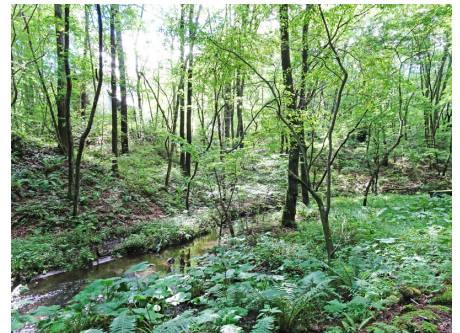
別荘地内にある自然公園のせせらぎ