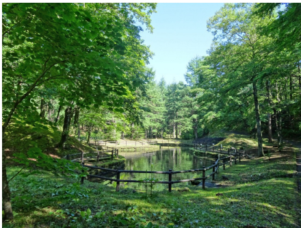
夏にはニジマスが放流される人工池