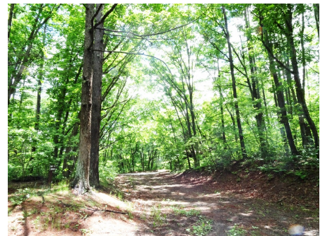
別荘地内（未舗装エリアもあります）