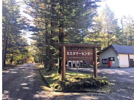
カスタマーセンター（別荘地内）