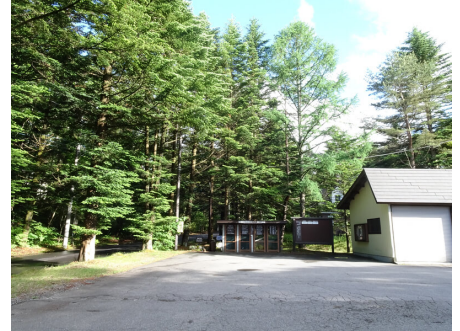
きちんと管理されているゴミ置き場