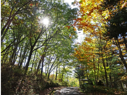
木漏れ日が心地良い別荘地内の様子

弊社の兄弟会社が管理する別荘地。軽井沢から車で40分程度の管理された別荘地です。平坦な区画が多く森の中の雰囲気味わえます。