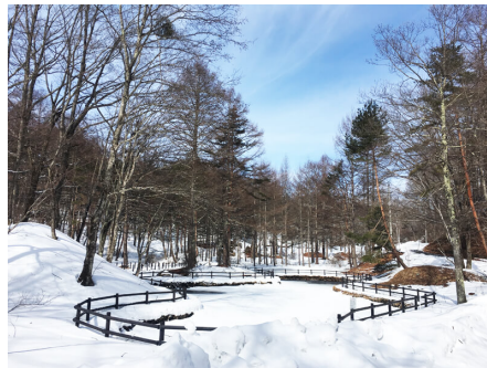
人工池の冬の様子