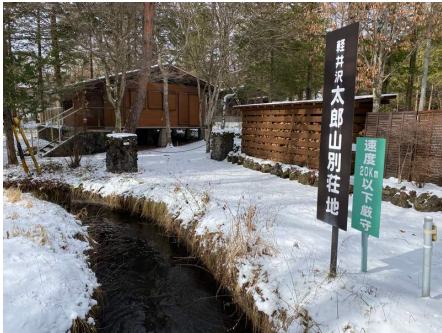
別荘地入口看板と千ヶ滝用水

中軽井沢と追分の中間地点に位置する太郎山別荘地。西武千ヶ滝別荘地西区の南西に位置します。区画数は少なく山の斜面を利用した落ち着いた雰囲気のある別荘地です。