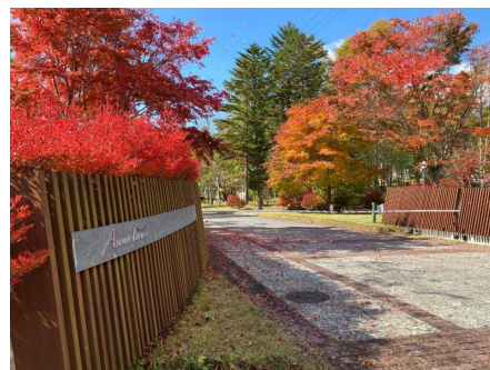
別荘地内（あさまテラス入り口）