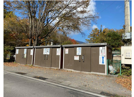
ゴミ置き場（各所あり）