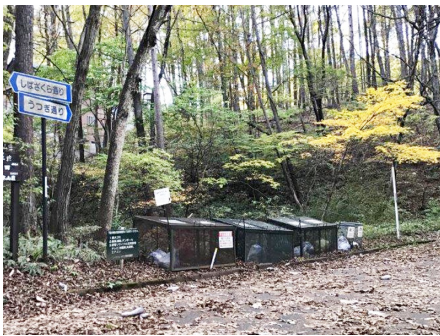
ゴミ置き場（各所あり）