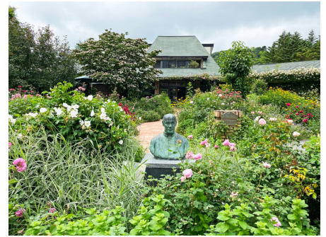
管理事務所（レイクニュータウン内）