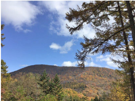
別荘地内からの眺望

旧軽井沢の愛宕神社北東部の別荘地。愛宕山の東側斜面となる為、傾斜の区画が多いです。冬季（12月～3月頃）の水道供給は停止され、期間中の道路に除雪は入りませんので、注意が必要です。