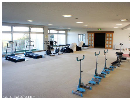
海を眺めながらスポーツルーム