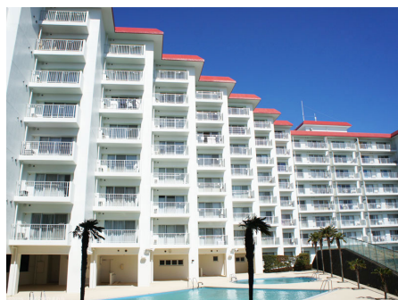
プールから見るシーアイヴィラ