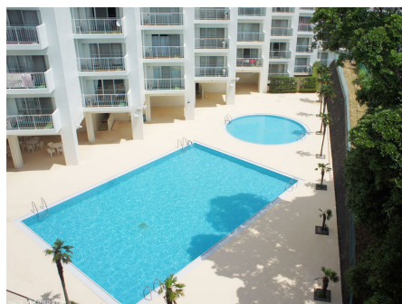
リゾート感ある屋外プール